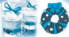
キャンドル作り & リース作り