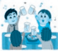
那須森のビール園 バイキング