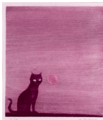
清宮質文「夕日と猫」1979年 茨城県近代美術館 照沼コレクション