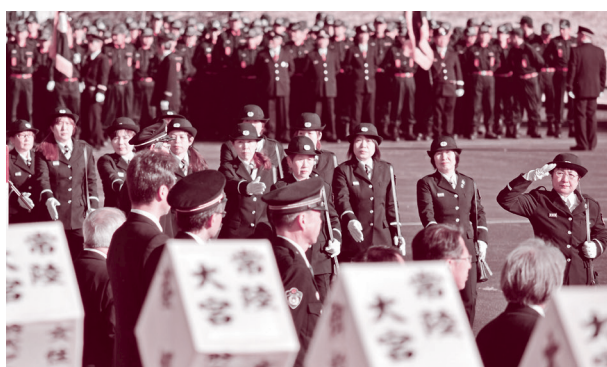
▲分列行進を行う女性消防団員