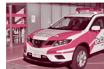
茨城ドクターカー