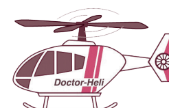
栃木ドクターヘリ