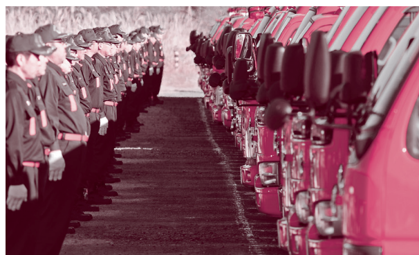
▲機械器具点検のため車両の前に並ぶ消防団員