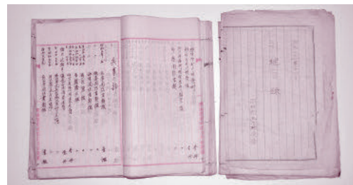
▲玉川村役場文書(当館蔵)

昭和28年9月に町村合併促進法が施行され、各村に合併調査会が組織されると、玉川村では近隣の大賀村・塩田村との3か村合併と、大宮町との合併との2案を検討しました。同村の合併調査会は昭和29年11月には後者の案を採用することで決定し、翌30年3月に大宮町ほか6か村が合併しました。