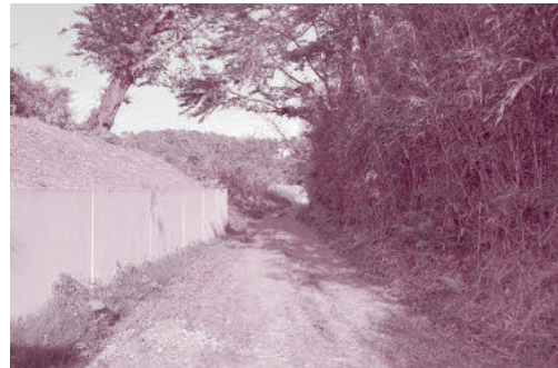
▲明治の玉川村役場の前を通るかつての国道293号線