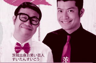
茨城出身お笑い芸人 すいたんすいごう

第1学年 (25~35才までの男女) 旅行代金(お一人様あたり) 男性6,000円・女性4,000円