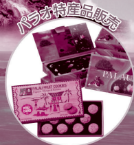
パラオ特産品販売