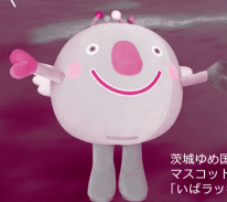
茨城ゆめ国体 マスコットキャラクター 「いばラッキー」