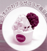
パラオかわプラザコラボ商品販売