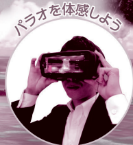
パラオを体感しよう