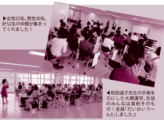
▶女性22名、男性30名、計52名の仲間が集まってくれました!

※この旅程は各地の道路状況などにより、時間の変更となる場合がございます。現地での出発時間をご確認ください。 ※添乗員が同行して旅程管理を行います。 (記入例)バス