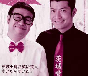
茨城出身お笑い芸人 すいたんすいこう