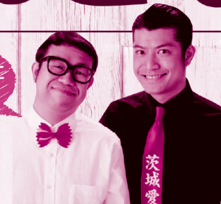
茨城出身お笑い芸人 すいたんすいこう

出会いを求めるあなた! どうせなら、楽しい ほうがいいよね! のどかな自然広がる 常陸大宮市で、旅を楽しみながらステキな 出会いを探してみたいか? 旅を盛り上げる 茨城出身のお笑い芸人すいたんすいこうをお供に、笑いあり、 ゲームあり、美味しいものありの大人の遠足へ是非、参加してね!