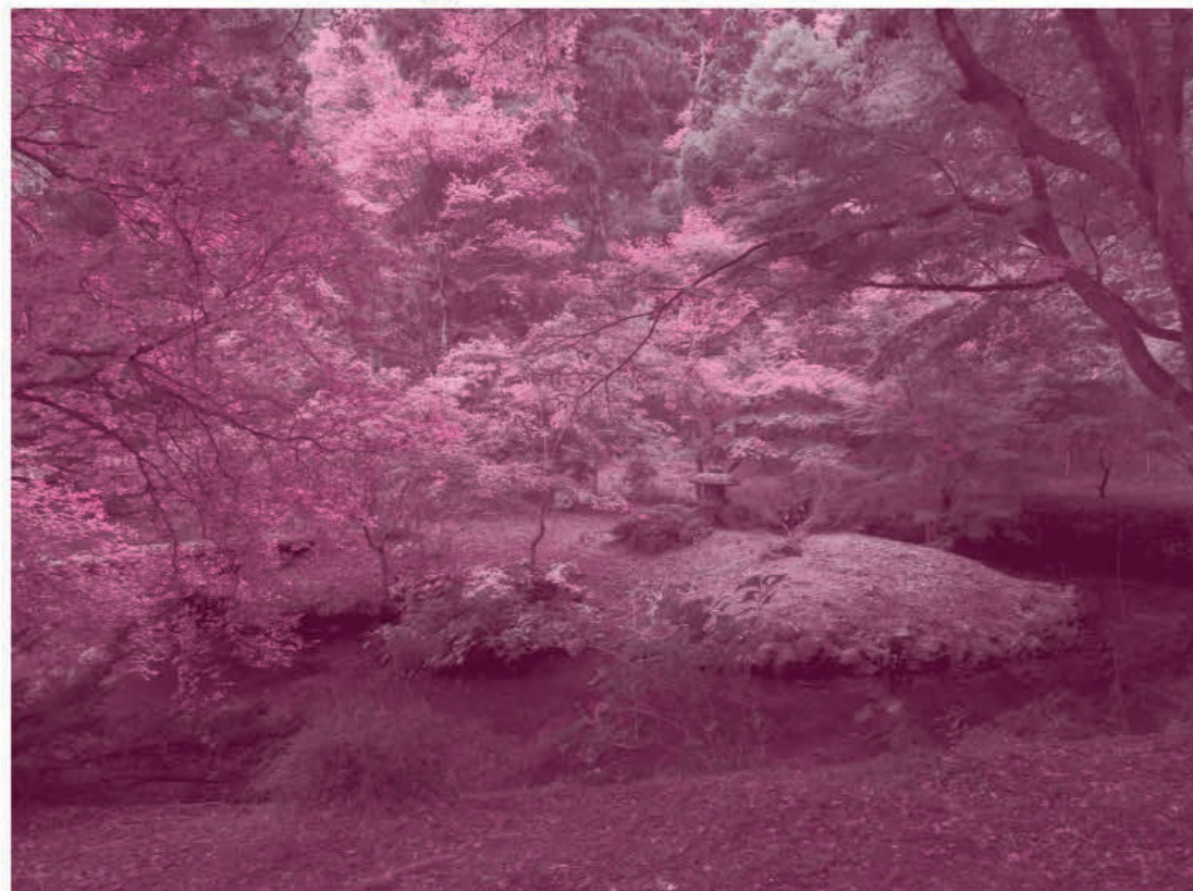
[岡山家住宅庭園 (養浩園)]