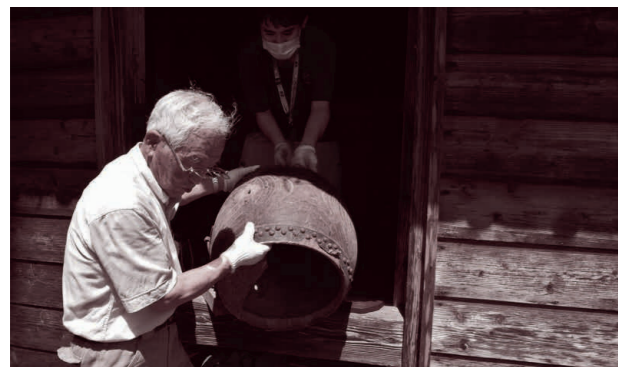
▲搬出作業のようす

市史編さん事業の一環として、山方地域に所在する古文書の調査を実施しました。野上地区に鎮座する諏訪神社の蔵に収蔵されていた資料を主な対象とし、蔵の清掃と埃をかぶった資料のクリーニングおよび搬出作業、資料の概要を記録するための目録作成を行いました。調査の結果、搬出された資料は900点近くにのぼり、その多くは、明治期に作成された土地利用に関する文書と旧野上小学校に関する史料でした。