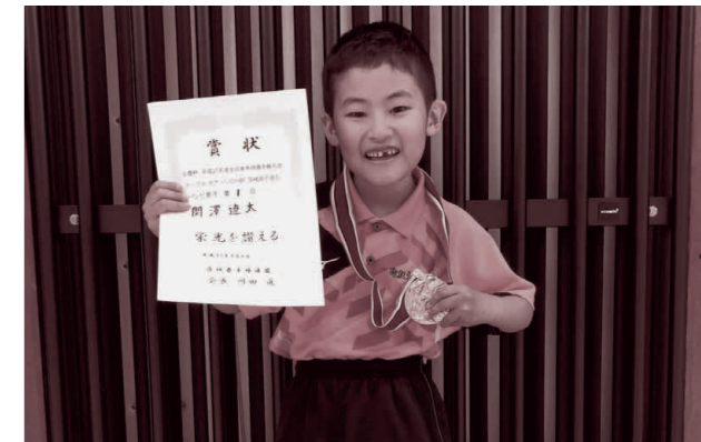
▲おめでとうございます