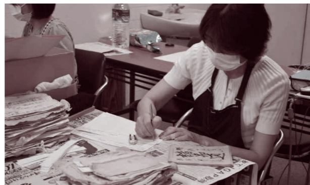
▲資料の概要を記録しました

今後の分析によって、明治以降の旧野上村の運営や教育の様子が明らかになるのではと期待されます。調査にあたっては、諏訪神社の氏子の皆さんや山方郷土史クラブなど市民の皆さん、茨城県立歴史館の研究員に協力をいただきました。今後も、市史編さん事業では地域に残されている古い資料の調査を進めてまいります。小さなことでも遠慮なく、地域の情報を文化スポーツ課までご連絡ください。よろしくお願いいたします。