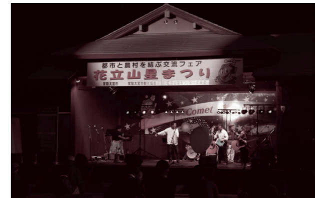
▲たくさんの人が訪れました

花立自然公園で、第29回花立山星まつりが開催されました。明峰中学校・小瀬高等学校吹奏楽部の演奏で始まり、小学生星まつりポスターコンクールの表彰式が行われました。その後、美スターや天体望遠鏡から星を眺める体験や手作り望遠鏡教室が開かれ、多くの子供達が天体観測に親しんでいました。