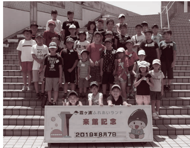
▲たくさんのことを学んだね！

市内小学生とその保護者42人が参加し、霞ヶ浦湖上体験スクール（主催：市環境市民会議）が実施されました。午前、行方市にある霞ヶ浦ふれあいランドの水の科学館で、地球と水の関係などを、展示物や遊具で学習しました。午後の湖上体験では、霞ヶ浦の歴史や水質、生物について学んだあと、実際に透明度を確認し、水生生物や微生物を調べたり、水道水と湖の臭いを嗅ぎ比べるなど、貴重な体験をしました。