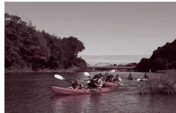
▲カヌー体験を楽しむ参加者

御前山・那珂川カヌーフェスティバル2019（主催：御前山・那珂川広域連携協議会）が道の駅かつら付近を会場に開催されました。夏日を思わせる暑さの中、101人の参加者が川面をわたる心地よい風を感じながら、カヌー体験やラフティングボートでの川下りなどを楽しみました。