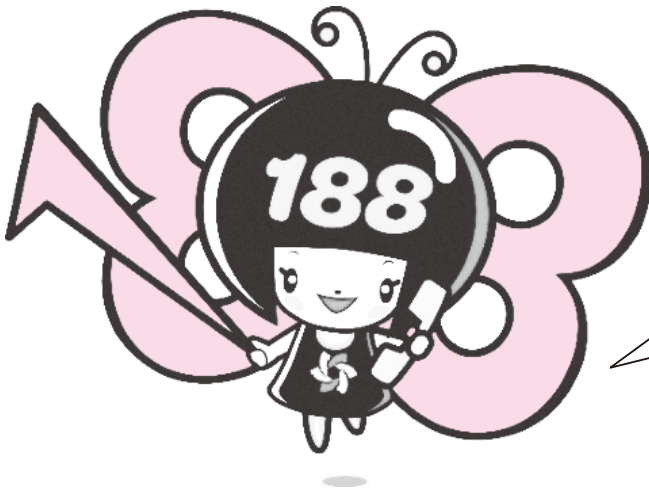
消費者庁 消費者ホットライン188イメージキャラクター 「いやヤン」

そんなときは一人で悩まずに、全国どこからでも3桁の電話番号でつながる消費者ホットライン「188（いやや!）」にご相談ください。最寄りの消費生活センターや消費生活相談窓口につながり、専門の相談員がトラブル解決を支援します。