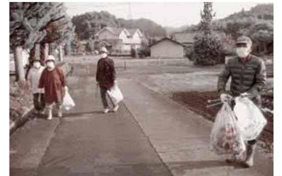
▲ご協力ありがとうございました

可燃ごみ約2,500kg、不燃ごみ約1,100kg、その他粗大ごみが回収されました。