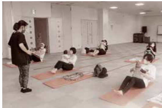
▲親子でリラックス

この講座は、産後のお母さんとそのお子さんが対象。コロナ対策で十分に距離を取りながら、今回は6組の親子が汗を流しました。育児の合間にもできるストレッチ方法やヨガのポーズが紹介され、親子で挑戦する場面も。和やかな雰囲気の中、リラックスした様子でヨガを楽しんでいました。