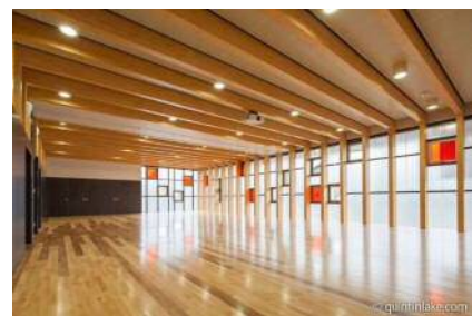
多目的スペースのイメージ

子育て支援や多世代交流の場として、リハビリ体験やフィットネスなど多目的に活用できる大空間を設けます。更衣室やシャワーを備えた利便性の高い施設を計画します。