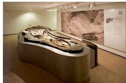
展示室のイメージ