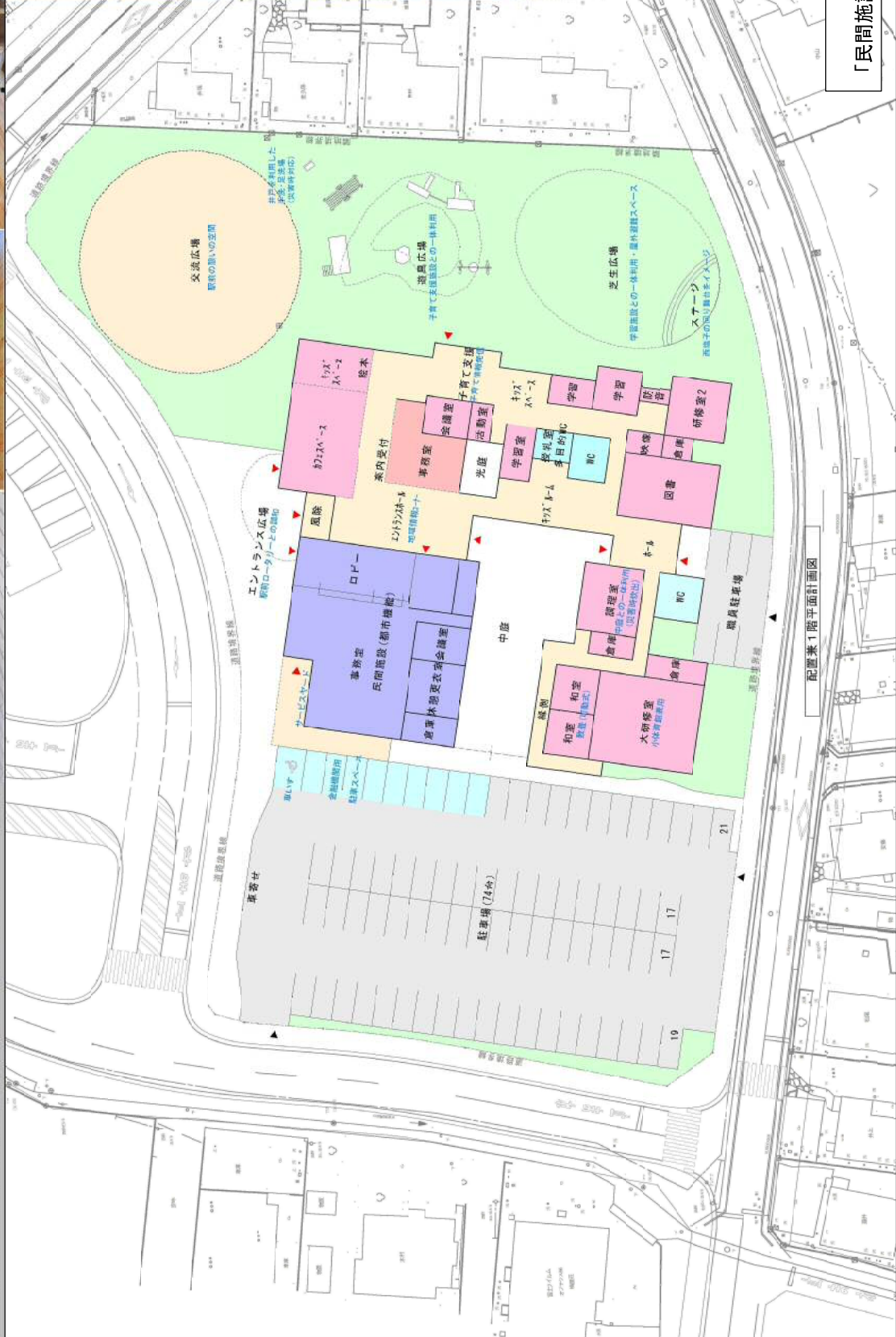
「民間施設十子育て支援・交流センター」