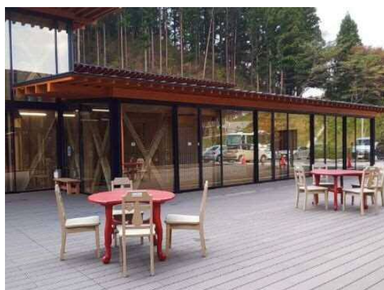
カフェスペースのイメージ