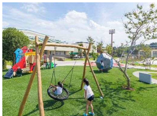
遊具広場のイメージ

金融機関やカフェなどを併設した子育て支援や多世代交流の場として、相乗効果を最大限に活かした計画とします。