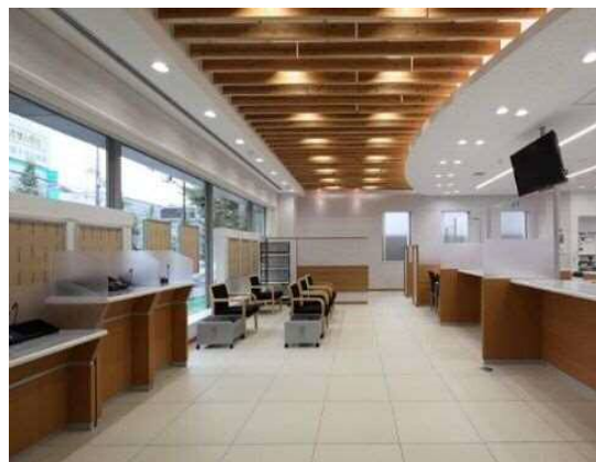
民間施設(金融機関)のイメージ