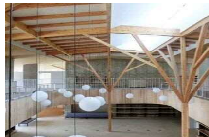
エントランスのイメージ

駅前広場に面した施設の「顔」として、2層吹抜の開放的な空間とし、シンボル展示に対応しながら、地場産木材を使用した特徴的な空間とします。