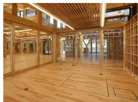
調理室のイメージ

料理教室などの各種講座に対応するとともに、災害時には一時避難場所として炊き出しにも対応できる計画とします。