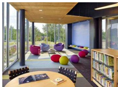
子育て支援室のイメージ

公園に面した明るく開放的な環境を確保し、様々な活動に柔軟に対応できるフレキシブルな空間とします。また、屋外との一体的な活動にも対応します。