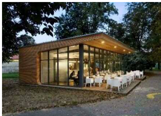
カフェのイメージ

地場産の木材を利用し、木の風合いを活かした建物とします。民間活力の導入を検討し、ハード・ソフト面共に魅力ある施設運営を図ります。