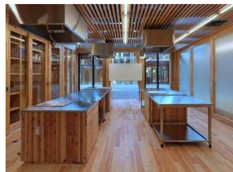
学習室のイメージ

楽器演奏や映像音楽の視聴に対応した防音室など、様々な市民活動や生涯学習に対応した学習室を設けます。