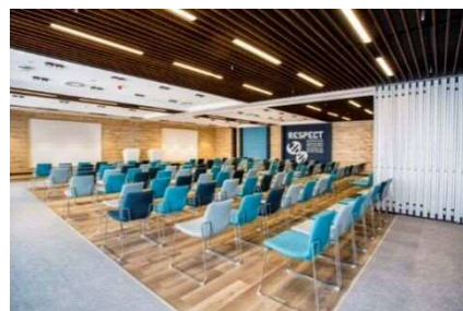
講座室のイメージ

様々な学習活動や講演会などに対応する講座室や文化活動に活用できる学習室を設け、歴史文化に対する理解を深めると共に、市民活動や生涯学習に対応した計画とします。