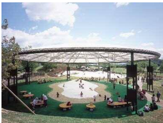
遊具広場のイメージ

ふわふわドームなど特徴ある遊具を設置し、テント屋根を設けるなど、全天候型の施設とします。ヘルスロード計画とも連携した健康増進施設としての整備も検討します。