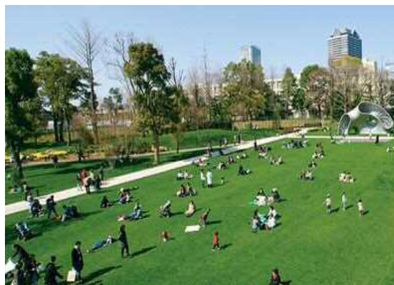
芝生広場のイメージ

中心市街地にある広大な広場は市民の憩いや集いの場として、様々な活動に対応します。