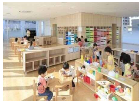
キッズスペースのイメージ

施設内の要所に絵本やおもちゃコーナーなどの子ども達の居場所を設け、子育て中の女性や保護者が安心して活動に取り組める環境を整備します。