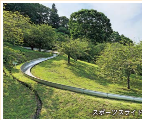
スポーツスライド