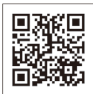
いばらきデジタル まっぷ

県では、山地災害が発生するおそれのある箇所を「山地災害危険地区」として指定しています。山地災害危険地区は、県林業課のHPや「いばらきデジタルまっぷ」で公表しておりますので、皆様がお住まいの地域における危険箇所の確認にぜひご活用ください。