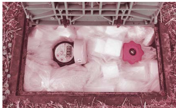
▲ メーターボックス内を発泡スチロールや布などで保温します。