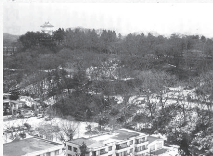
久保田城跡(秋田市)

会場：常陸大宮市文化センター ロゼホール 大ホール (常陸大宮市中富町3135-6)