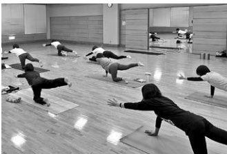
▲エクササイズの様子