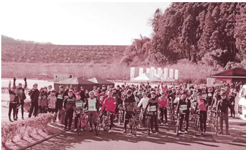
▲参加した皆さんで集合写真

抽選会では、常陸大宮市と城里町の特産品やゆるキャラグッズが当たるなど、参加された方からは、「楽しかった」「また参加したい」という声を数多くいただきました。