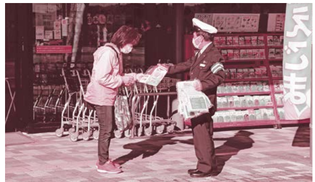
▲ご協力ありがとうございました

交通安全対策推進協議会、大宮警察署、交通安全協会大宮支部、大宮地区交通安全母の会連絡協議会、大宮地区安全運転管理者協議会、手をつなぐ育成会の皆さんが参加し、買い物などに来店された方へ、チラシや啓発グッズを配布しながら交通事故防止や犯罪被害者への配慮などの呼びかけを行いました。