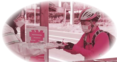
◀ 鮎の塩焼きどうぞ