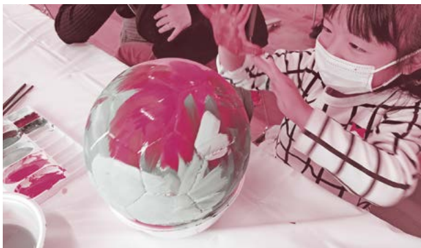
▲カラフルなボールに変身！

当日は、16組30名が参加し、思い思いに色を塗ったり、模様を描いたりして、使い古されたボールが素敵なアートボールに生まれ変わりました。