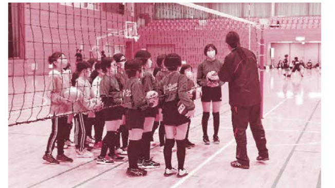
▲バレーボール体験