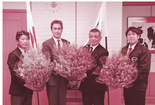
▲ありがとうございました

寄贈された花桃は、市役所の窓口や市内保育園、認定こども園に飾られ、ピンクや白の花桃に、一足早い春の訪れを感じました。