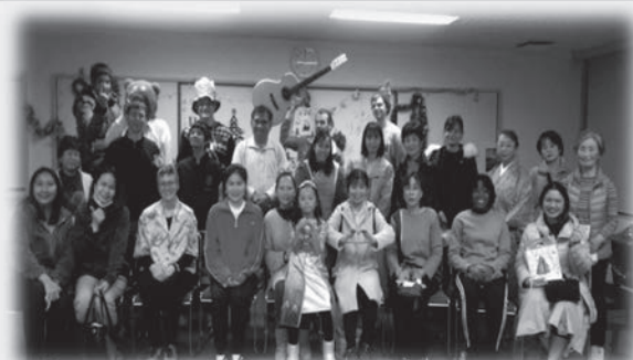
日本語教室のクリスマス会