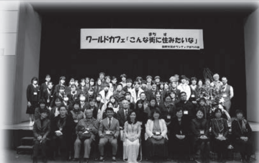
ワールドカフェ「こんな街に住みたいな」