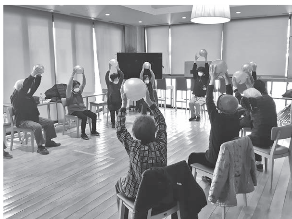
▲まちなかサロンの様子

「こうなくてははいけない」という決まりはありません。参加者の方たちで楽しくできる内容、例えば、茶話会や簡単な体操、ゲームなどのレクリエーション、介護予防についての勉強会などを行います。