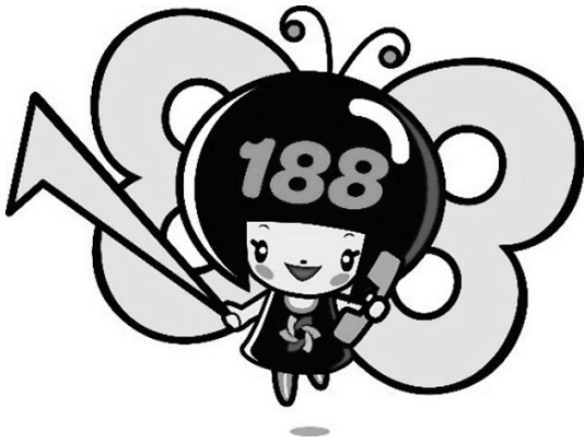
消費者庁 消費者ホットライン188イメージキャラクター 「イヤヤン」

そんなときは一人で悩まずに、全国どこからでも3桁の電話番号でつながる消費者ホットライン「188(いやや!）」にご相談ください。専門の相談員がトラブル解決を支援します。