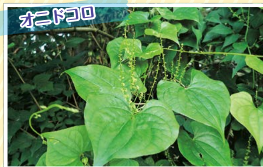
(ヤマノイモ科 ヤマノイモ属)

山野に生えるつる性の多年草です。地中の茎は肥厚して横に伸びひげ根を出します。地上の茎は他物に巻き付いて長く伸びます。葉は交互につき、ハート形をしています。雌と雄は別株です。7～8月ごろ、雌株は葉のわきから長い花序を垂れ下げ、淡緑色の花を咲かせます。雄株の花序は上に伸びます。地中の茎(いも)は苦くて食べられません。