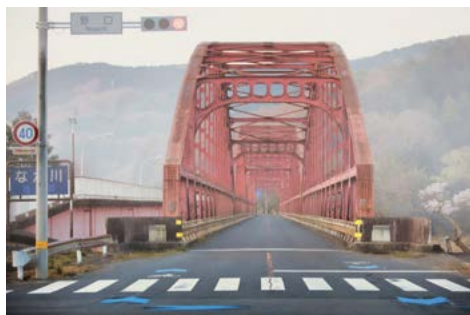
「那珂川大橋」

Instagramで「#常陸大宮市」「#常陸大宮」「#おおみやファン」のタグで投稿された素敵な写真をご紹介します！