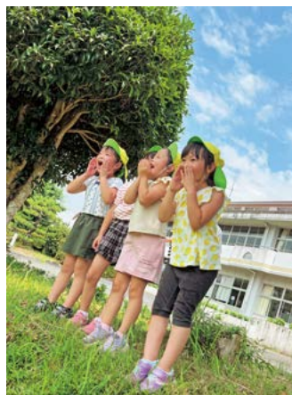
@gozenyama1294さんの投稿 「お散歩にて」