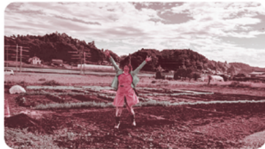
▲畑づくり、ここまで進みました！

料理イベントを通して、実際に触れて味わうことで、より身近に感じてもらえるのではないかと期待しています。