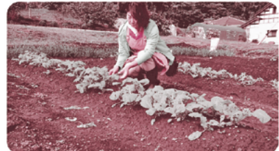
▲「かつを菜」の様子伺い