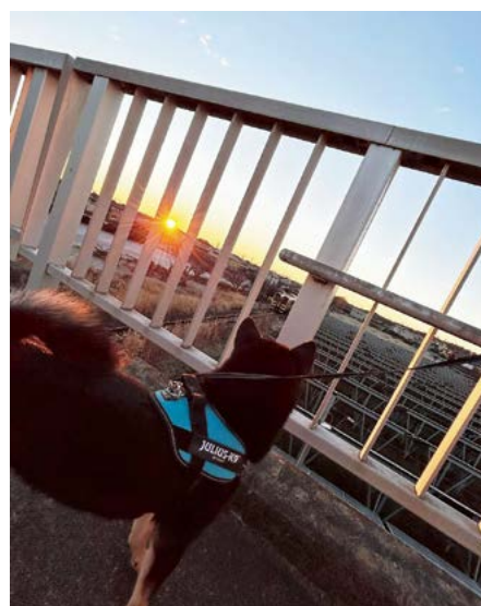
【初日の出×水郡線×柴犬】

常陸大宮市公式Instagramでは、リポスト・広報紙掲載企画実施中！ 市内の風景、イベント、何気ない日常など、ハッシュタグ「#常陸大宮市」「#常陸大宮」「#おおみやファン」いずれかを付けて投稿すると、市Instagram や広報紙で紹介されるかも！