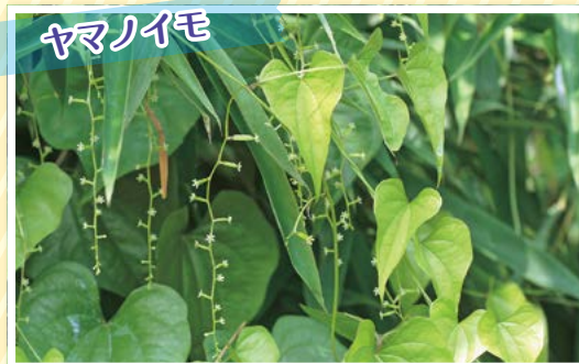
(ヤマノイモ科 ヤマノイモ属) (写真・データ提供 御前山ダム環境センター)

山野に生える多年草です。雄株と雌株は別の株をつくります。雄ばなの穂は上向きに立ち上がり、雌ばなの穂は写真のように垂れ下がります。果実は下向きにつき、平らなまゝい翼が3個あります。地下の芋は同じ芋が1年ごとに大きくなっていくわけではなく、春に古い芋の先に別の新しい芋ができ、古い芋から養分を吸収して大きくなり、毎年古い芋より大きな芋を作るそうです。