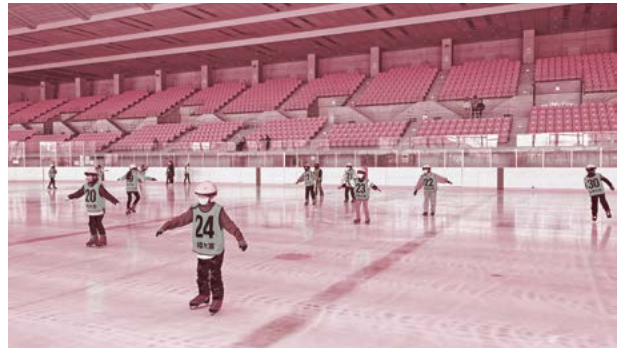
▲滑り方の基本を練習している様子

2日間で55名の児童が参加し、靴のはき方や立ち方・転び方などの初歩的な内容や、滑り方のコツを学びました。転倒を繰り返しながらも、すぐに上達し、最後の自由滑走では、楽しくスイスイと滑ることができました。