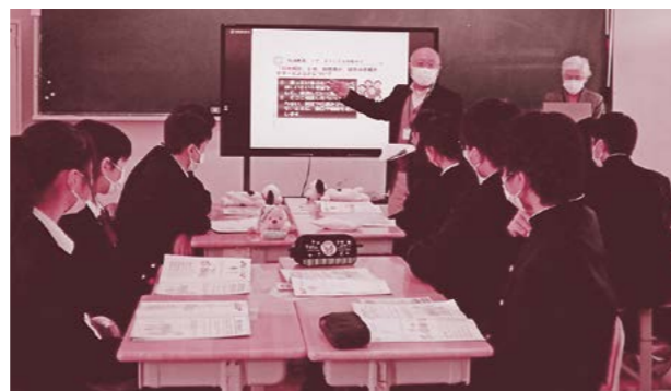
▲行政相談の仕組みを説明する様子

参加した生徒たちからは、「行政相談について分かりやすく学べた」、「自分の住む地域について考える良い機会になった」などの感想がありました。