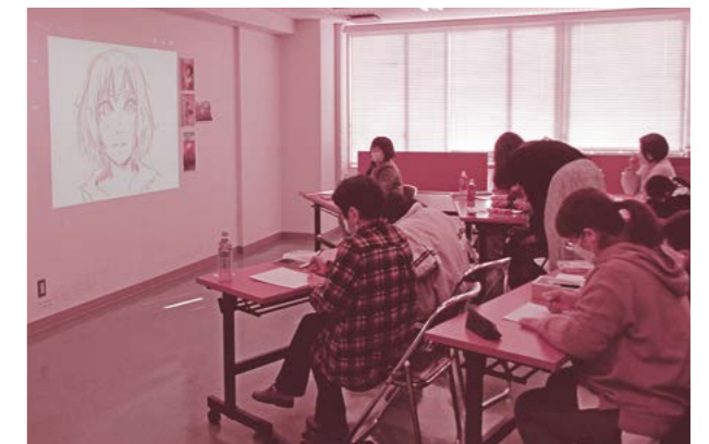
▲海外出身者による似顔絵講座の様子