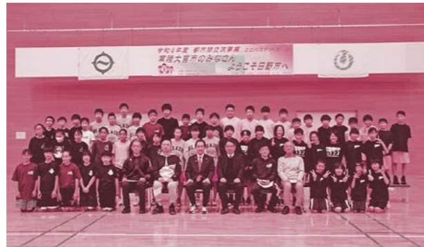
▲日野市交流事業に参加した皆さん

東京都日野市にある市民の森ふれあいホールで、日野市の子供たちとミニバスケットボールによる交流会を行いました。日野市とは、本市に日野自動車テストコースがあることが縁で交流事業が始まり、今年、交流開始から10年の節目の年を迎えました。常陸大宮市から約50名、日野市から約60名が参加した今回の交流では、交流試合やフリースロー大会を行い、スポーツを楽しみながら交流を深めました。