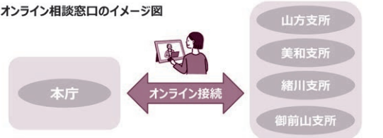
オンライン相談窓口のイメージ図

この相談窓口は『顔を映すカメラ』と『書類を映すカメラ』を用いたテレビ会議システムです。相談者は、最寄りの支所からのテレビ通話により、電話では伝わりにくい申請書類の書き方や手続き方法などを本庁舎の担当職員と相談することができます。