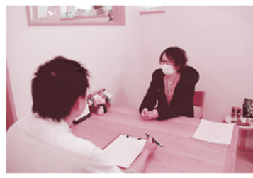
▲取材中にちょっとした雑談も