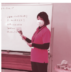
▲ワークショップの様子

令和5年1月8日（日）に、かわプラザにて「和ハーブ七味づくりワークショップ」を開催しました。参加者の方それぞれが、個性豊かなブレンドで、会場は笑顔と素敵な香りに満たされました。