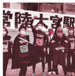
▲メンバーと記念撮影

令和5年1月15日（日）に、ランニング教室に参加したことのある有志の方々と、「常陸大宮駅伝大会」に参加しました。ランニング教室参加者と継続的な活動が出来るよう、現在検討中です。