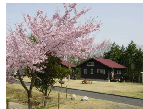
既存観光施設のブラッシュアップ