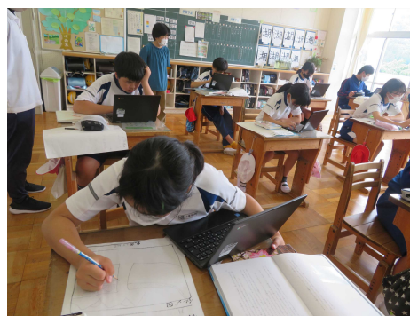
タブレット型PCによる学習