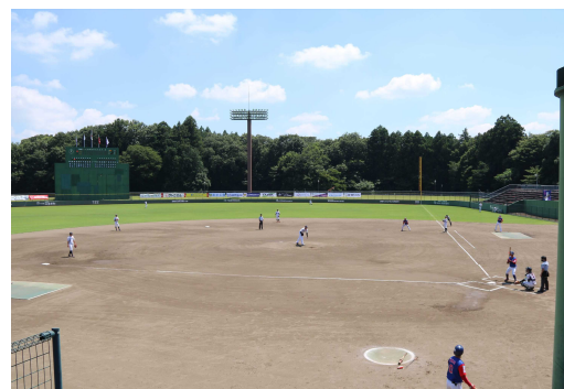
大宮運動公園市民球場