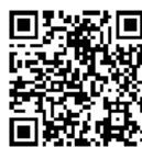
受診可能な医療機関