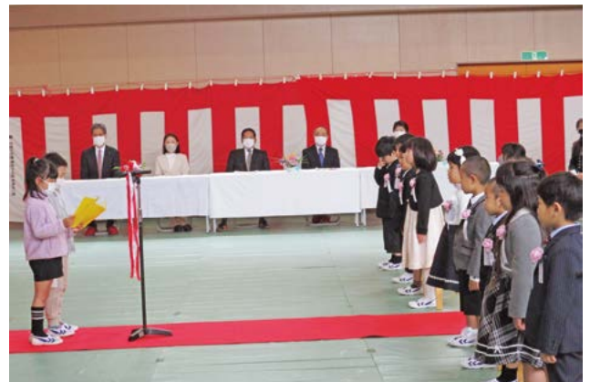
▲山方小学校 入学式の様子