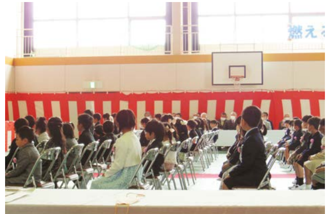
▲大宮小学校 入学式の様子