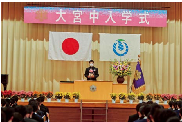
▲大宮中学校 入学式の様子