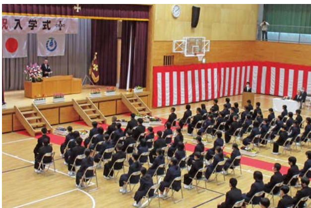
▲第二中学校 入学式の様子