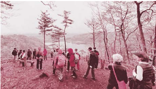
▲御前山ダム湖周辺の景色を楽しみながら、汗を流しました。