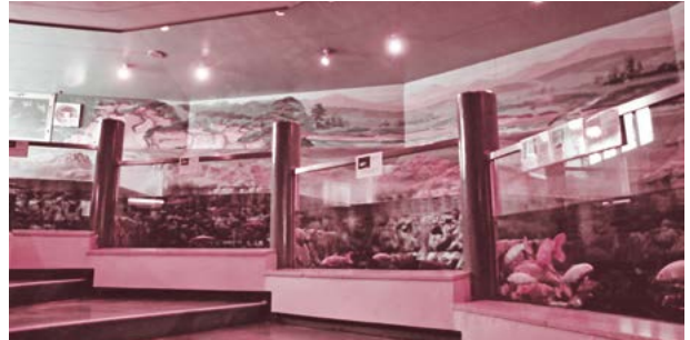
▲山方淡水魚館内の様子