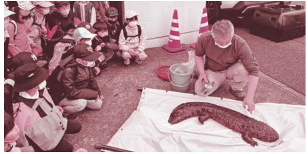
▲地域の子供たちに見送られながら、オオサンショウウオの引越作業を行いました。

3月24日から3月31日まで、施設の無料開放を行い、市内外からたくさんの方が訪れました。