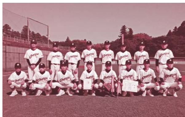
▲優勝した常陸大宮市立第二中学校