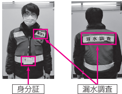
漏水調査員の服装