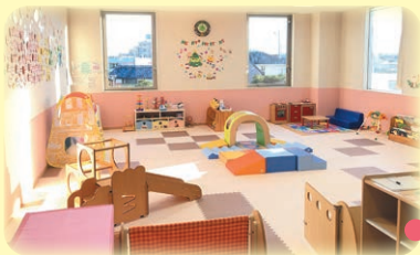
～個室の相談室がありますので プライバシーは守られます～