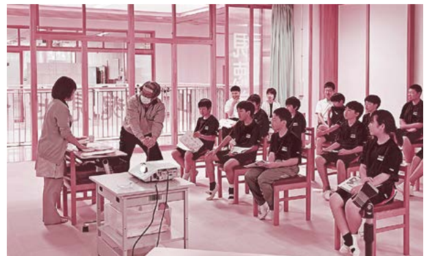
▲山方中学校1年生が受けた認知症サポーター養成講座では、認知症の方との関わり方を劇で伝えました。

市では随時、地域や学校などで認知症サポーター養成講座を行っていますので、お気軽に長寿福祉課へご相談ください。