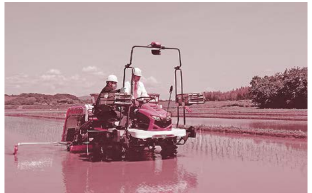
▲(右) 記念お田植えを行う鈴木市長

今年は 3.9ha の水田で農薬や化学肥料を使わずにお米が栽培されます。収穫されたお米は、市内の学校給食に取り入れられます。