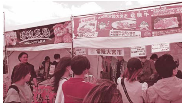
▲常陸大宮市ブースで揚げたての瑞穂牛メンチカツ、コロケなどを販売しました。

友好都市である秋田県大館市で開催された「第8回 肉の博覧会 in おおだて」に出展しました。昨年に続き2回目の出展となった今回、市の特産品「瑞穂牛」を使用したメンチカツやコロケ、カットステーキなどを販売し、多くの方に味わっていただきました。「去年美味しかったからまた来た」とリピーターになってくれた方もいて、常陸大宮市の魅力を、食を通してPRすることができました。