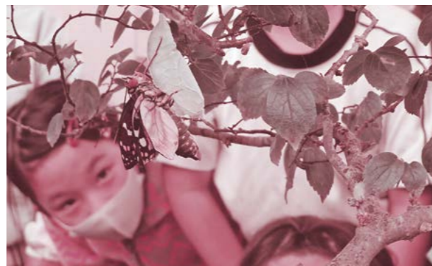
▲オオムラサキ羽化の瞬間を緒川小3年生が見守りました。

今年3月、緒川小学校の校庭で幼虫が発見され、その後飼育されていた国蝶「オオムラサキ」が羽化し、自然へと還されました。オオムラサキは、里山の落葉広葉樹林などに生息していますが、環境省で準絶滅危惧種に指定されている蝶です。科学クラブの活動で緒川小校庭にある榎の落ち葉からオオムラサキの幼虫を発見したことがきっかけで飼育がスタート。飼育は蝶の生態を学ぶ3年生に受け継がれました。そして、6月14日午前10時ごろ羽化が始まり、貴重な瞬間を見届けました。翌日には3年生全員で校庭の榎の木へと還し、蝶へ別れを告げました。