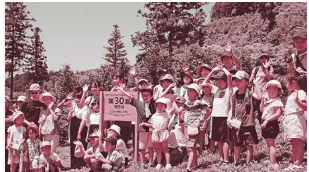
▲赤ちゃんの頃に植樹した苗木と成長した姿で再会しました。

「ピジョン美和の森」で、7年前に植樹した木が自分の背丈より成長しているのを確認したり、同日開催の鷲子山上神社夏季例大祭の見学などを行いました。猛暑の中でしたが、子供たちは元気に夏の日を楽しみました。