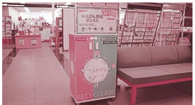
▲こども課前に設置された哺乳びん回収ボックス。環境に配慮し、ダンボールなどで作られています。

※回収はピジョン(株)製の哺乳びん、乳首、フード、キャップに限ります。他社製品や破損しているものは対象外です。