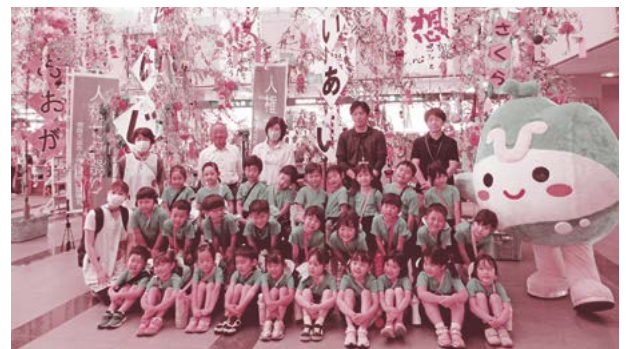
▲七夕飾りを見に訪れた聖愛保育園年長 まつ組の皆さん

展示開始日の6月30日には、各保育園、保育所児童が市役所を訪れ、自分の書いた短冊がどこに飾られているかを見たり、七夕飾りとともに記念撮影していました。