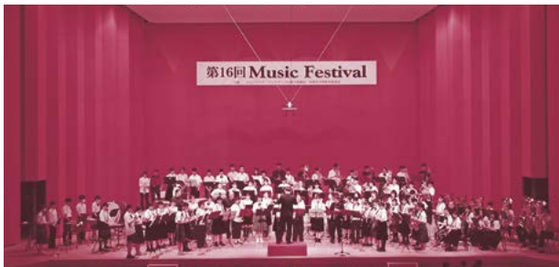
▲第3部の合同演奏では出演者全員で「吹奏楽と打楽器のためのセレブレーション」「宝島」を演奏しました。

プログラム最後の合同演奏では、1部2部の出演者に市内高等学校吹奏楽部、顧問の先生方も加わったのパフォーマンスに、来場者から大きな拍手が送られました。