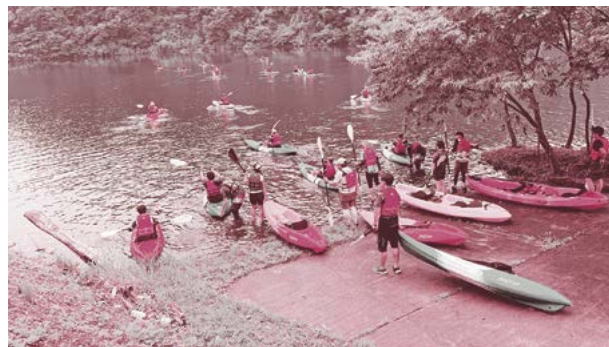
▲水戸からサイクリングで御前山ダムに到着したあと、ダム湖面でカヌーを楽しむ参加者の皆さん

24名の参加者は、自転車で水戸市の千波湖を出発し、御前山ダムまでの片道35kmを、田園風景を楽しみながらサイクリングしました。御前山ダムでは、カヌーに乗り、湖面で涼みながら、癒しの時間を満喫しました。