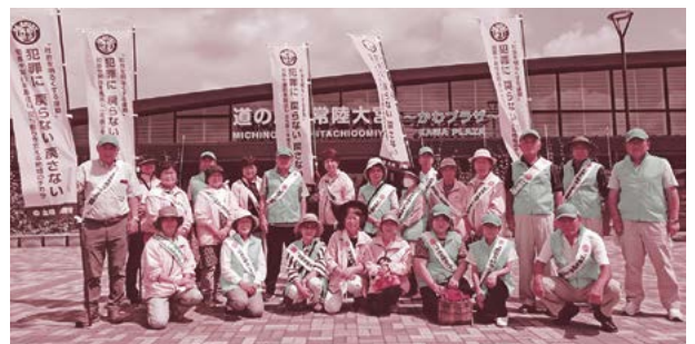
▲道の駅常陸大宮ではグッズの手渡しとともに、「社会を明るくする運動」の啓発を行いました。