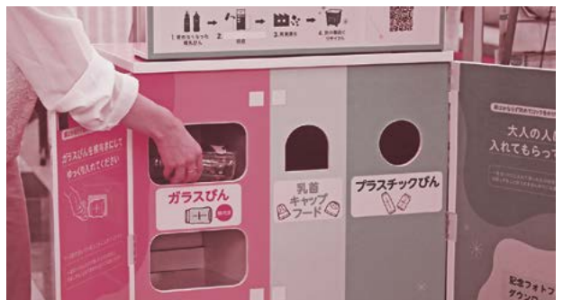
▲ガラスびん回収部分は緩やかな坂になっており、割れないような工夫がされています。