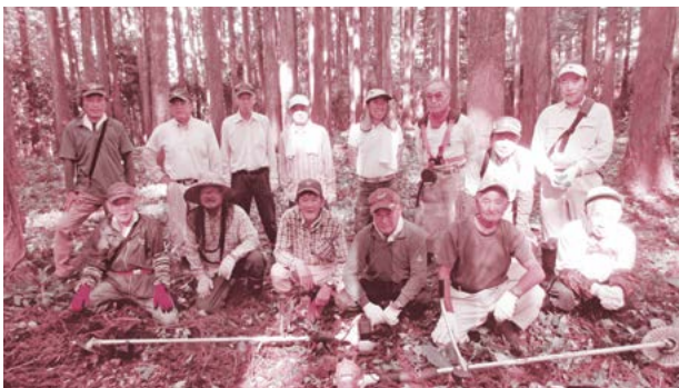
▲この日はボランティアメンバー14人が集って草刈りを行いました。

この日も地元の人たちが草刈り機を持参し、遠方から訪れる方々に気持ちよく見学してもらおうと、草刈りに汗を流しました。