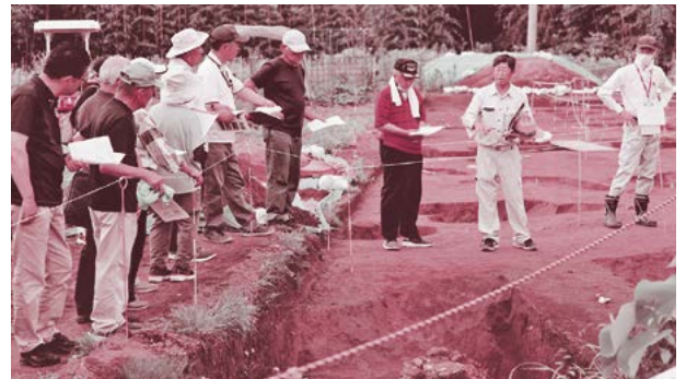
▲実際の城跡を見ながら、調査によって発見された堀を解説している様子

説明会では、調査で発見された4つの堀や、高級な茶道具として知られる天目茶碗 てんもくちやわん などについて、調査を行った関東文化財振興会から解説があり、参加者は熱心に聞き入っていました。