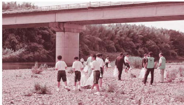
▲大宮中学校生徒が久慈川河川敷を清掃する様子

大宮中学校や大宮第二中学校の生徒、ボランティア団体による久慈川・那珂川河川敷のゴミ拾いも4年ぶりに行われ、地域の子供たちが、市の自然の象徴である2つの川の環境美化に取り組みました。