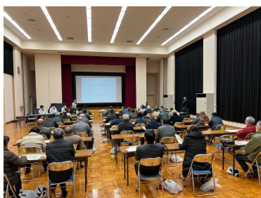
森林所有者説明会