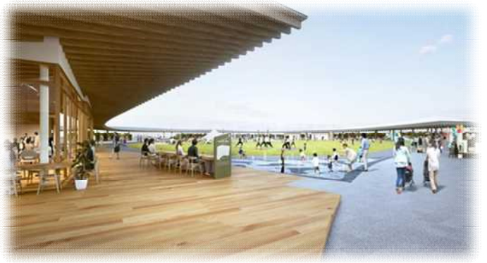
▲小さな子供でも安心して水遊びができるドライ噴水 (地面から直接水が出る噴水)