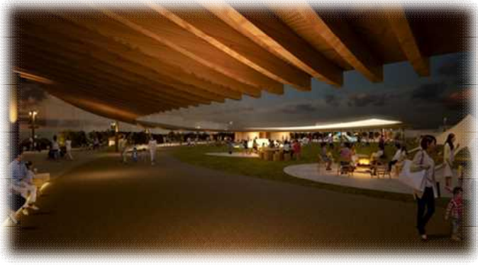
▲夜間も人の存在や賑わいを感じ、安心して利用できる 照明計画