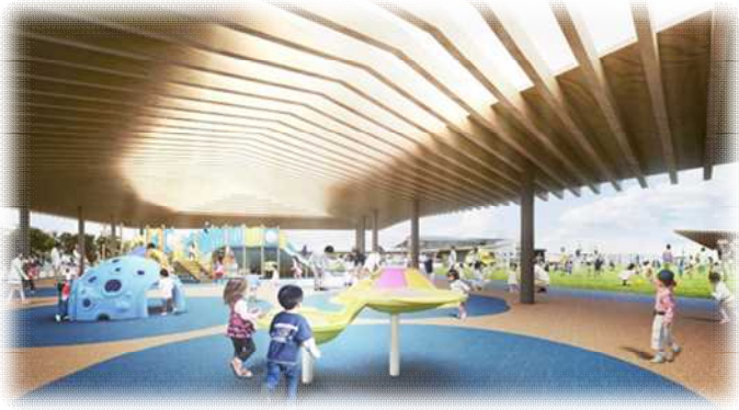
▲性別・年齢・言語や能力に関わらず遊ぶことができる インクルーシブ遊具