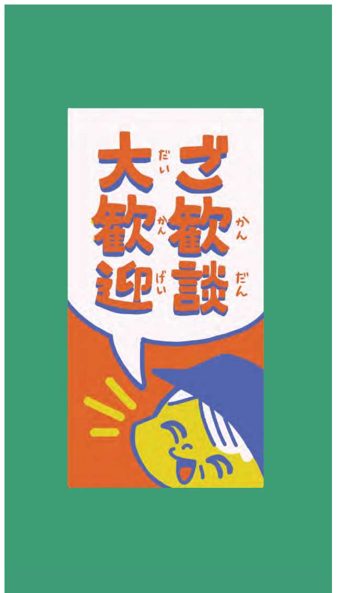
ステッカー レトロで遊び心のあるステッカーです。ワタヒキ写真館の壁やアルバムなどに貼ってあります。