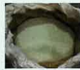
破砕・選別したガラス