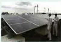
太陽光発電設備の検査の様子

使用済みとなった太陽光パネルには、再販売可能なものもあり、既に多くのリユース事例が報告されています。