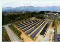
リユース品を使用した発電所