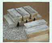
有用金属(銀)のイメージ