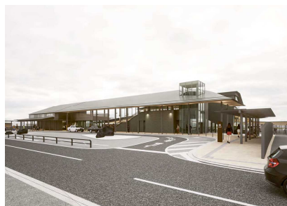
東口イメージパース