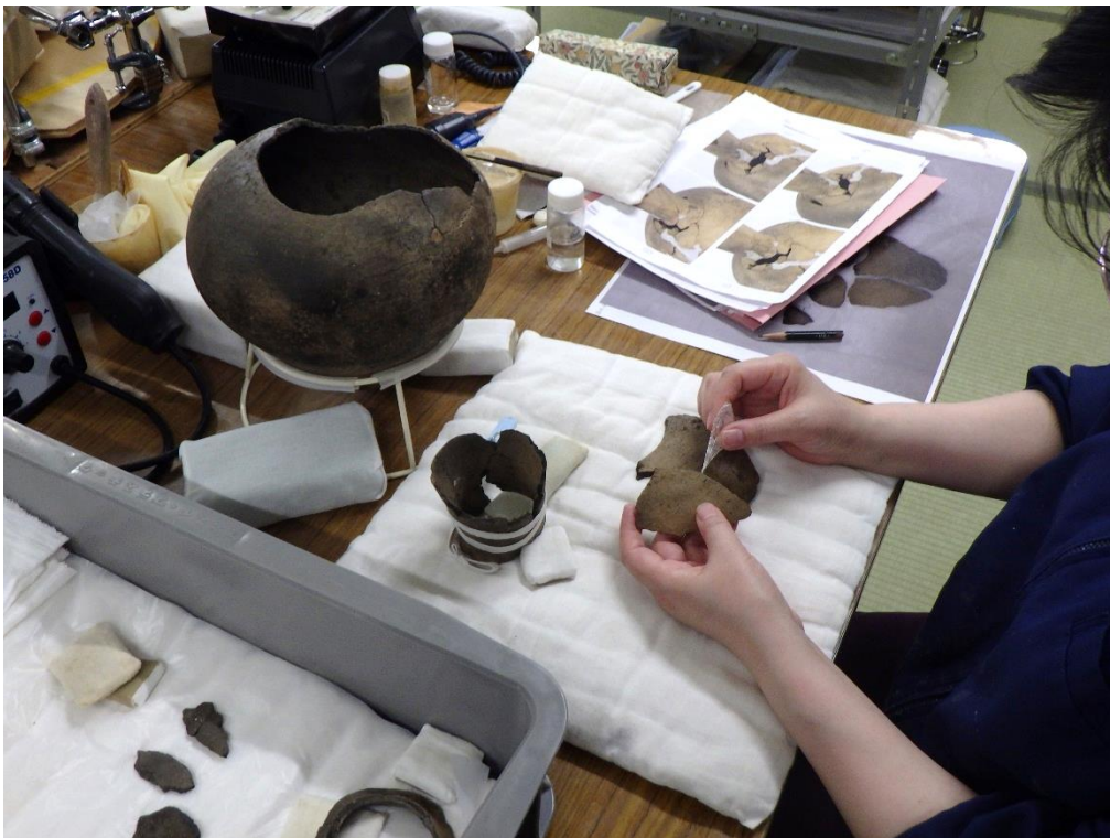
・接合（接着剤で接合し、欠損部分は樹脂で埋めていきます）