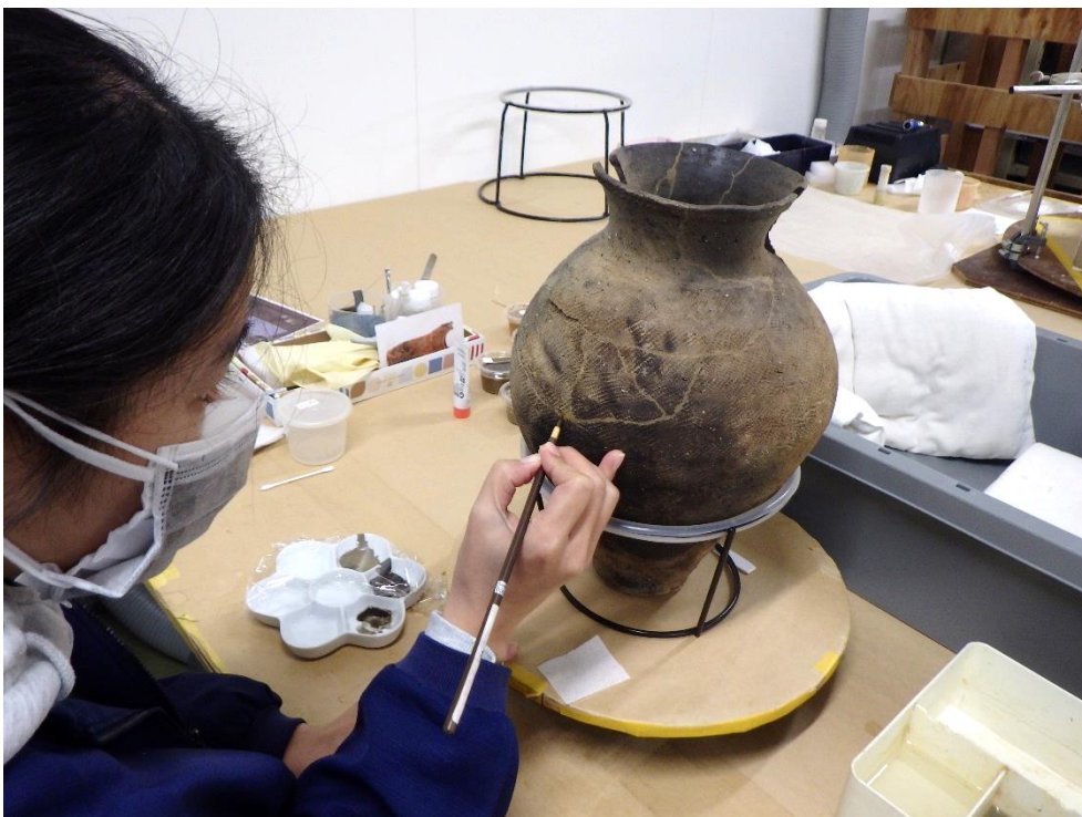
・補彩（最後に復元部分の色を塗ります）