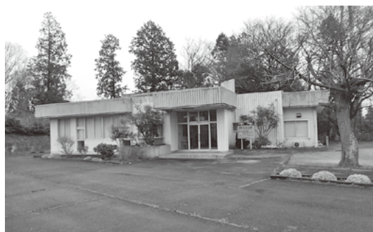
山方高齢者コミュニティセンター (野上地区)