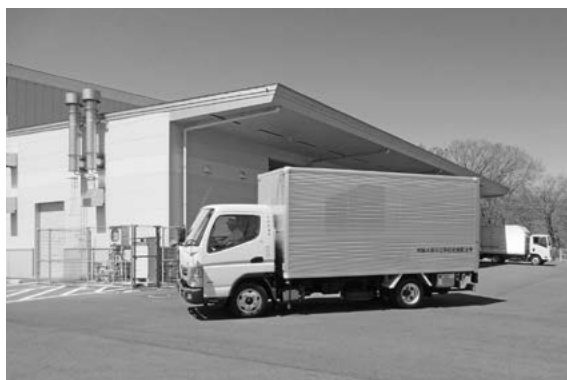
常陸大宮市学校給食センター