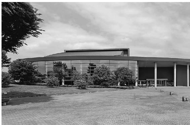
【移転先】常陸大宮市文化センター