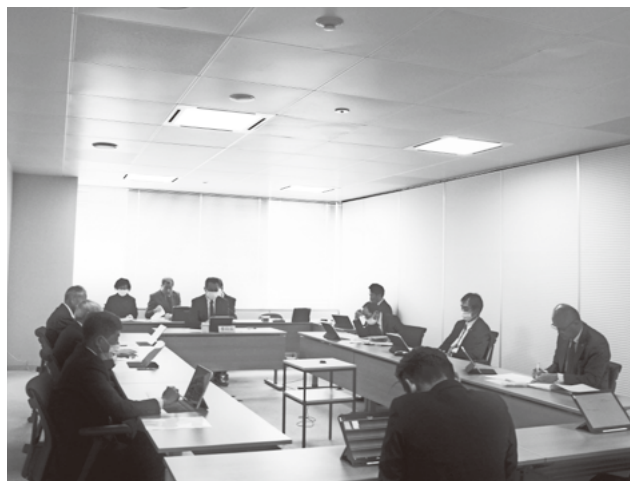
第1回議会定例会会期日程について