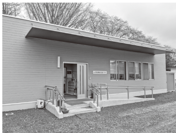
山方放課後児童クラブ