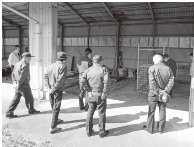
現地踏査：箱わな保管場所