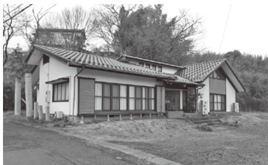
大賀地区センター (小祝地区)

A 今回の条例の一部改正は、両施設の集会施設としての用途廃止をするためのもので、今後、どのような用途・利用が可能かを検討し、用途・利用がなければ最終的に解体ということもあり得ますが、すぐに解体に至るものではありません。