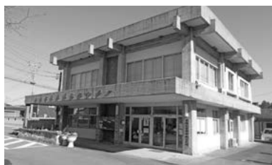
常陸大宮市中央公民館