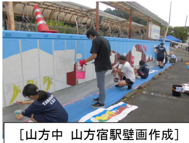
〔山方中 山方宿駅壁画作成〕