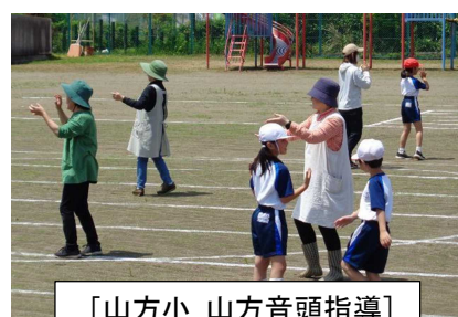
〔山方小 山方音頭指導〕