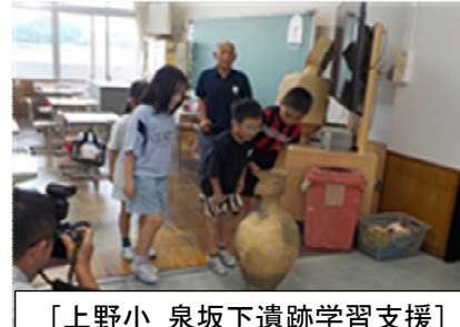
〔上野小 泉坂下遺跡学習支援〕