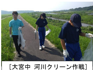
〔大宮中 河川クリーン作戦〕