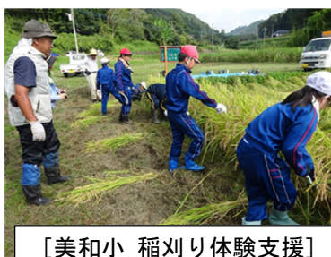
〔美和小 稲刈り体験支援〕