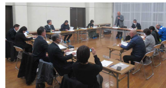
〔山方中学校区の実行委員会の様子〕

常陸大宮市地域学校協働本部第2回実行委員会を、各中学校区とも2月に開催し、本年度の事業報告をしました。以下の表は、各中学校区の実施回数の実績（4月～12月まで）を集計したものです。すべての活動において、ほぼ前年度より増となりました。これもボランティアの方の支援があつての成果です。