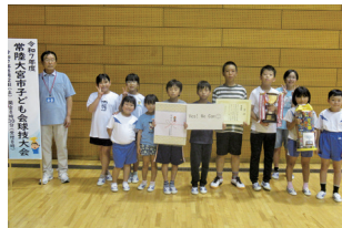
【準優勝】大賀小支部 Yes! We Can☺