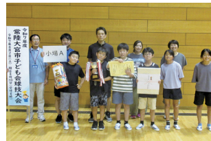
【第3位】村田小支部 小場A