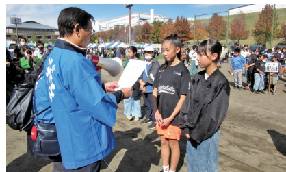
【優勝】村田小支部 小場子ども会