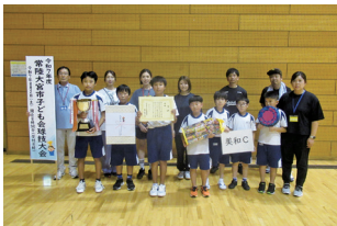
【優勝】美和小支部 美和C