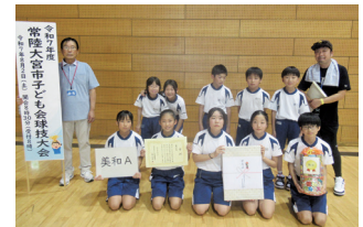
【第4位】美和小支部 美和A

本年度の球技大会は10チーム、総勢130人でドッジビー大会を実施しました。市子ども会独自のルールを制定し、子どもたちが普段行っているドッジボールのようなルールでできる参加しやすい競技となっています。大人も参加できるため、親子のふれあいや異年齢の交流を楽しみながら、白熱した試合が多く見られました。