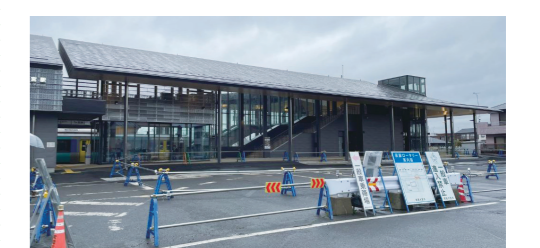
▲東口駅前広場整備予定場所